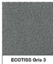
ECOTISS Gris 3