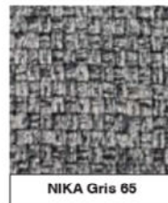
NIKA Gris 65