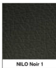
NILO Noir 1