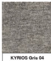
KYRIOS Gris 04