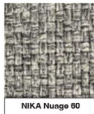
NIKA Nuage 60