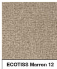
ECOTISS Marron 12