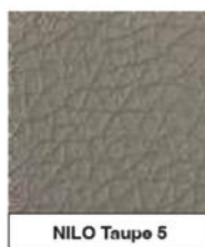
NILO Taupe 5