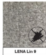
LENA Lin 9

ANTI-TÂCHE, HAUT POUVOIR IMPERMÉABLE. Les fibres textiles sont traitées Teflon® anti-tâches directement dans la masse, les propriétés de confort et d'apparence du revêtement ne sont ainsi pas altérées.