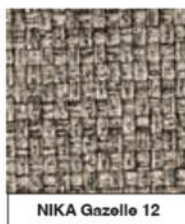
NIKA Gazelle 12